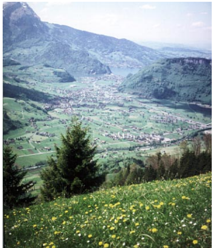
Sicht auf Stanserboden

Bei der Kirche Büren beginnt der Aufstieg, meist über offenes Land hinauf nach Schwanden, wo der markante Umsetzer steht. Während knapp 1.5 km bleiben wir auf der Buochserbergstrasse. Dann zweigt links ein Fussweg ab, der uns direkt zur Trogmatt hinauf bringt. Nochmals folgen wir etwa 800 m der Strasse und erreichen den Gibel Pt. 1182, von wo wir erstmals hinüber nach maria-rickenbach blicken können. Ein ebener Wanderweg führt uns den Südabhängen des Buochserhornes entlang direkt nach Niederrickenbach