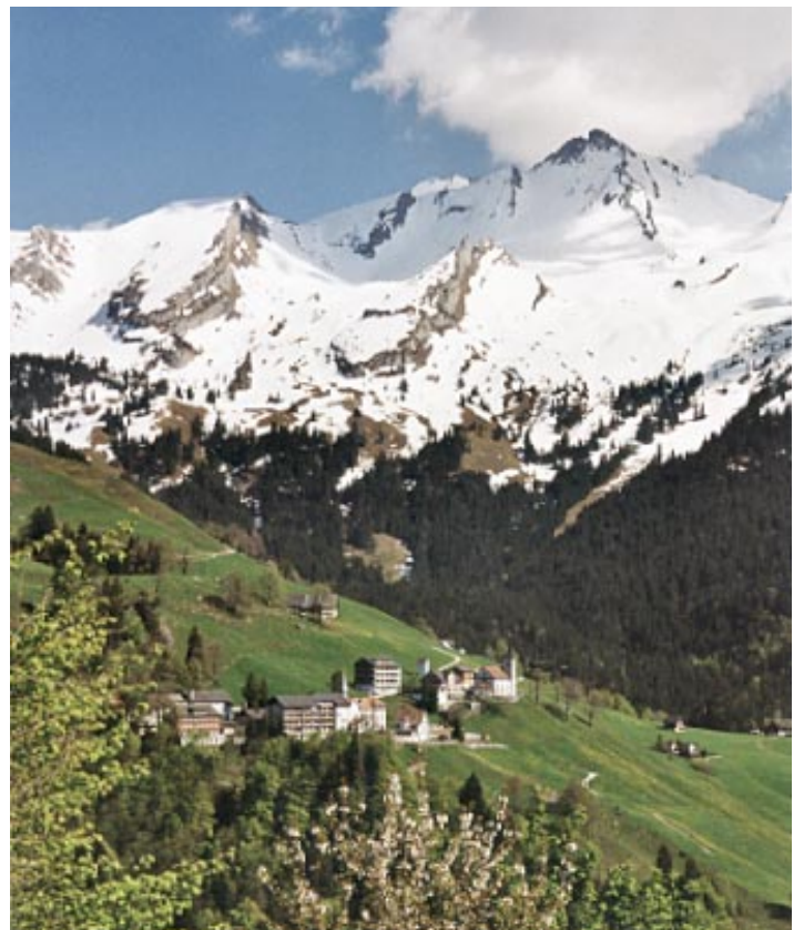
maria-rickenbach mit Brisen

Bei der Einfahrt zu den Parkplätzen der LDN beginnt die Buochholzbachstrasse, der wir bis zum Rastplatz bei der oberen Buoholzbrücke folgen. Hier verlassen wir die Asphaltstrasse und steigen im Wald auf dem markierten Wanderweg hoch. Mehrmals überqueren wir die Waldstrasse und erreichen das «Ghirmhittli» einen alten hölzernen Unterstand (ghirme heisst ausruhen). Nach einem weiteren Aufstieg erreichen wir eine offene Waldwiese. Am Rand der Strasse sind schöne, holzgeschnitzte Stationen angebracht. Wir folgen der Strasse bis zu Pt. 892, wo wir den Buochholzbach überqueren. Nun gilt es noch den steilen Bergweg bis hinauf ins Bergdorf Niederrickenbach zu überwinden.